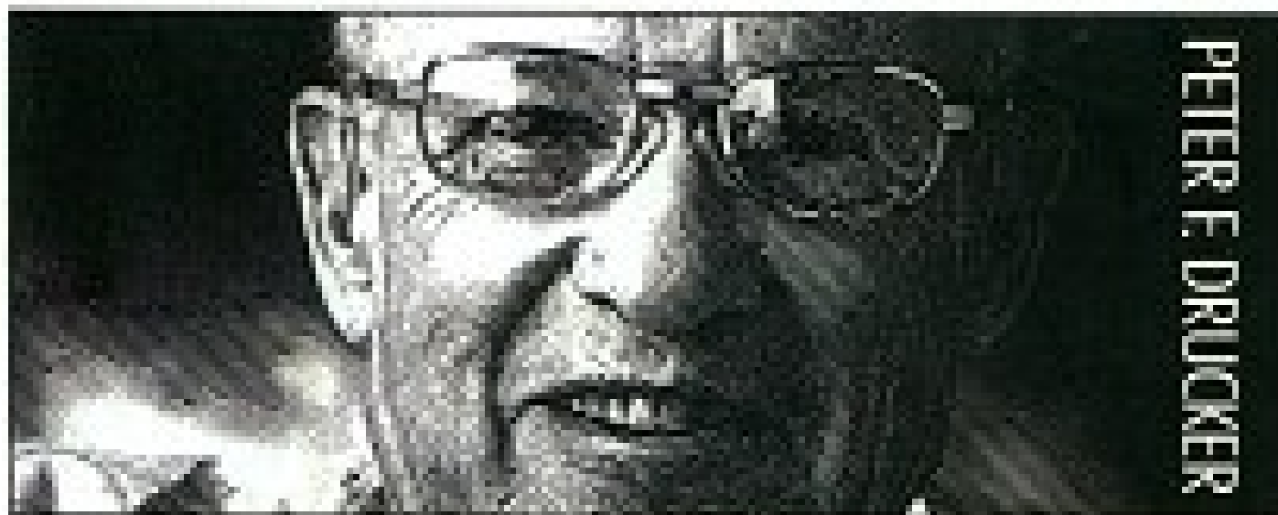
PETER F. DRUCKER

"NGƯỜI PHÁT MINH RA NGÀNH QUẢN TRỊ" – BusinessWeek