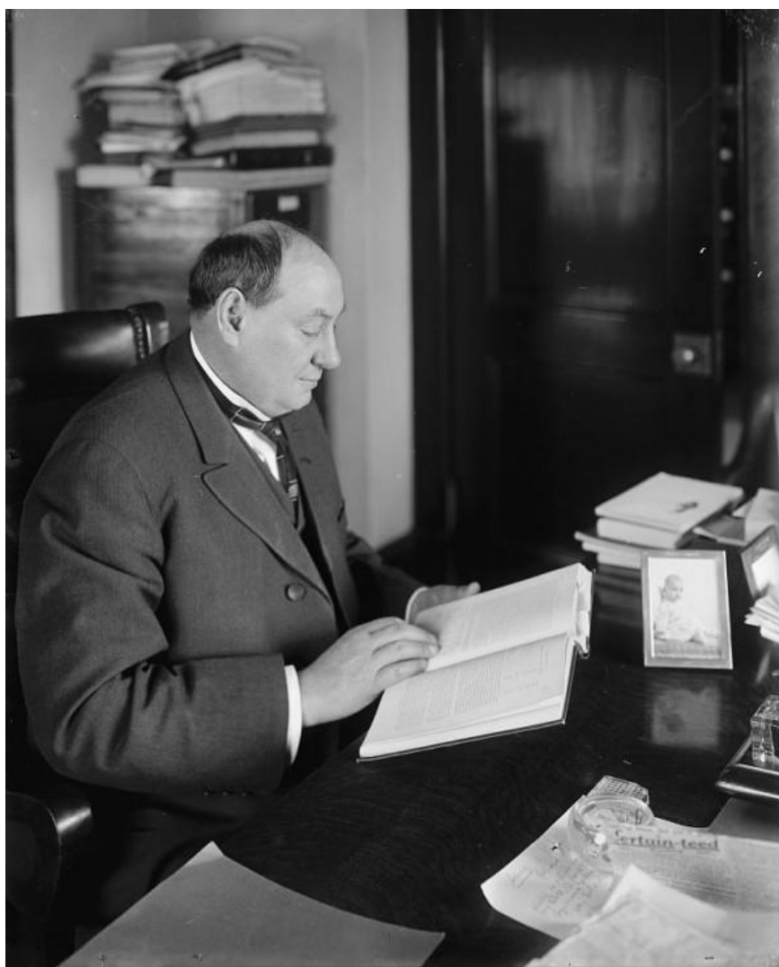
Hình Tiến sĩ Harvey Washington Wiley (1844 - 1930)

Nhóm Poison Squad có một thời hoàng kim, được người đời quý mến, như các phi hành gia ngày nay vậy.