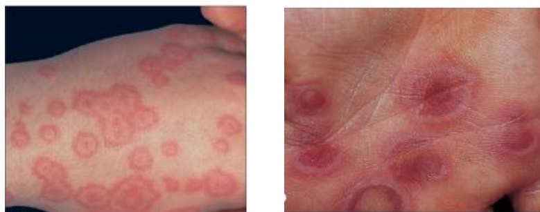
Ảnh 1. Hình bia bắn điển hình

Thương tổn đặc trưng của hồng ban đa dạng là hình bia bắn điển hình. Đó là những thương tổn hình tròn, đường kính dưới 3 cm, ranh giới rõ với da lành, được tạo nên bởi ít nhất 3 vòng tròn đồng tâm, hai vòng ngoài có màu sắc khác nhau bao quanh một tâm ở giữa sẫm màu (là nơi có sự phá hủy của thượng bì để hình thành nên một mụn nước hoặc vảy tiết).