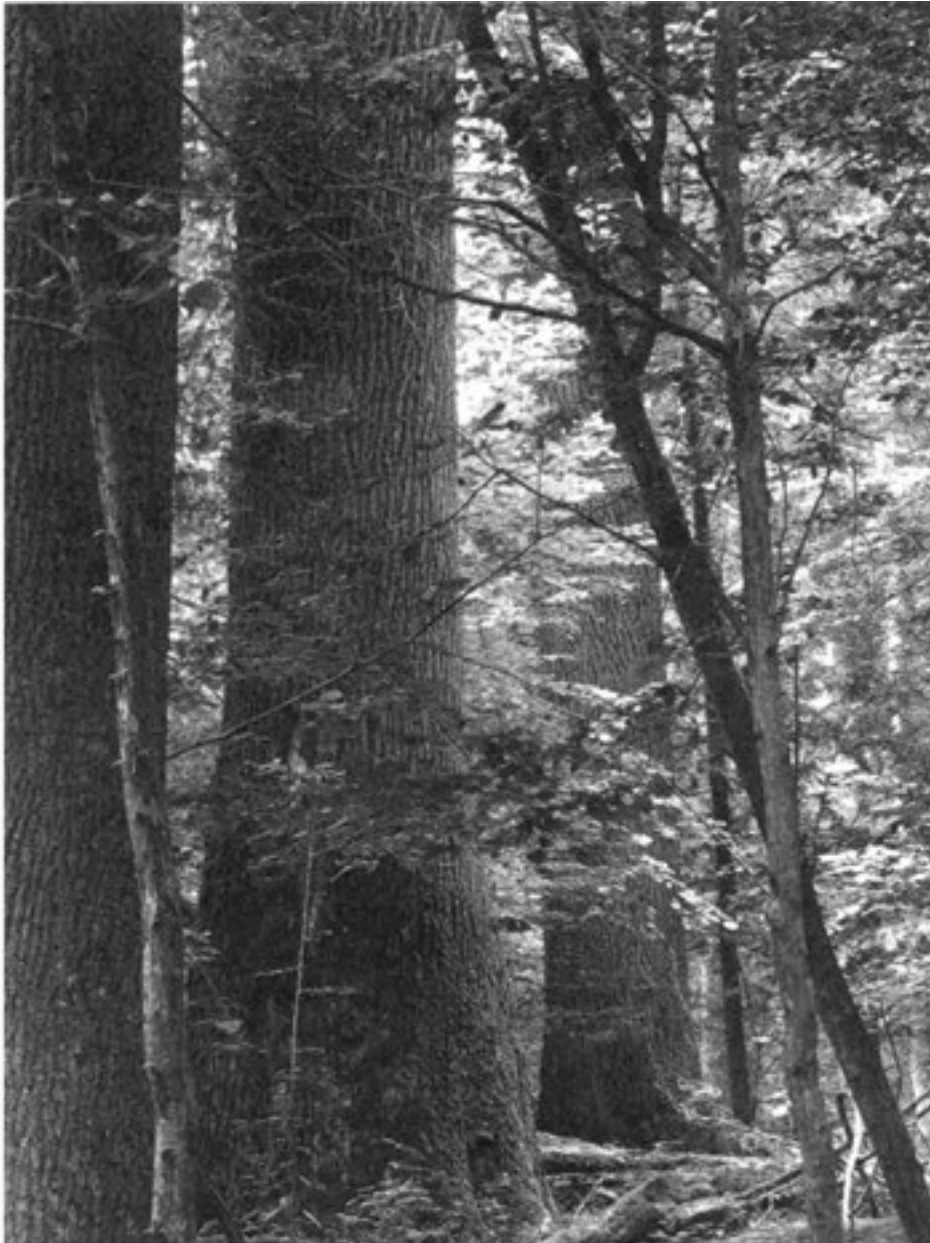
Bialowieza Puszcza, thuộc Phần Lan..

không những chú bò rừng có thể sẽ tàn lụi theo họ.