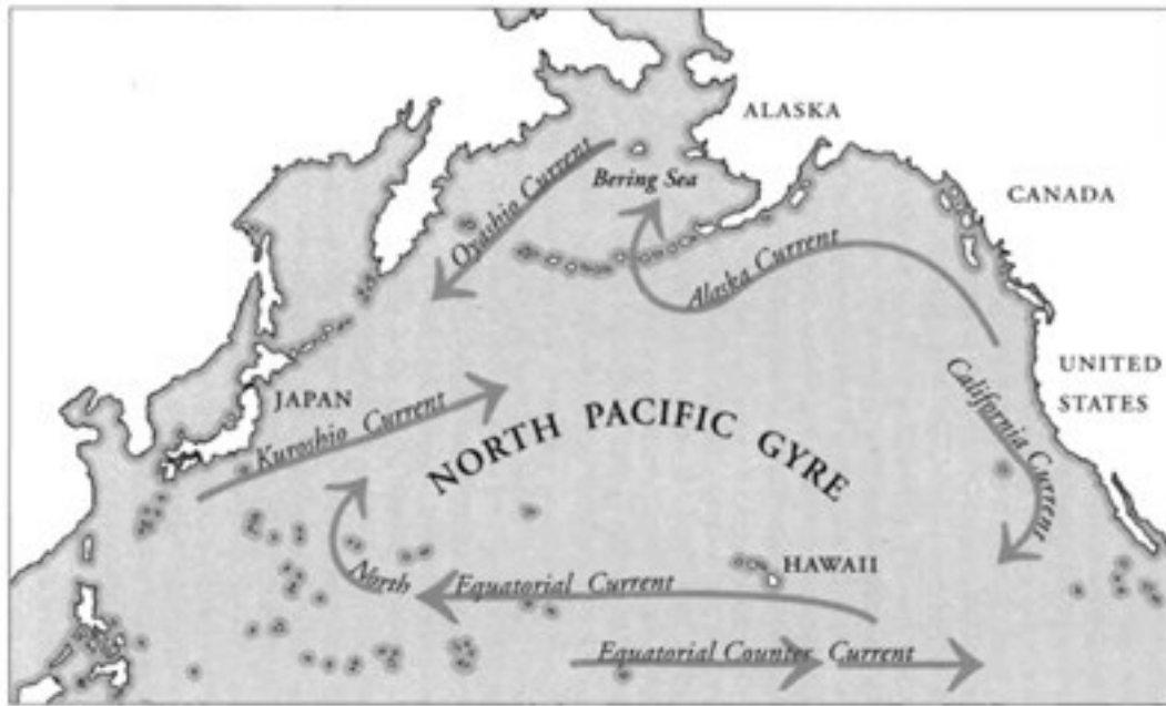
Map of North Pacific Gyre. MAP BY VOLUNTEER SERVICE

Ông đã phát hiện ra lý do thực chất mà các bãi rác trên thế giới không chứa đầy nhựa là vì phần lớn chúng đã trôi dạt vào bãi rác thải ở đại dương. Sau một vài năm lấy mẫu ở những dòng biển tuần hoàn ở Bắc Thái Bình Dương, Moore đã kết luận rằng 80% những thứ nổi lềnh bềnh giữa đại dương ban đầu đều được thải ra từ đất liền. Nó đã bị thổi bay khỏi các xe chở rác hoặc bãi rác thải, đổ từ các thùng chứa vận chuyển bằng đường sắt và hoặc trôi xuống cống, chảy vào các sông hoặc cuốn theo gió, và tìm đường thoát ra dòng biển xoay vòng rộng lớn này.