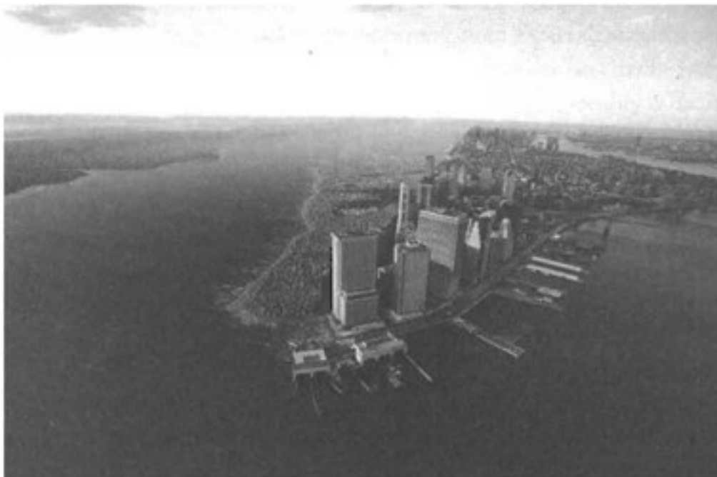
Hình ảnh Manhattan

bồng bong dẫn đến miền nam mà nay đã trở thành “bất khả tháo gỡ”– họ dường như không thèm đếm xỉa đến địa hình địa thế. Ngoại trừ một số khối đập thạch khổng lồ không thể di dời trong Công viên Trung tâm và tại điểm cực bắc của hòn đảo, còn thì kết cấu địa hình của Manhattan đều bị nhào nặn và dồn ép vào những dòng suối, bị cào bằng và san phẳng nhằm tạo nên một thành phố hiện đại.