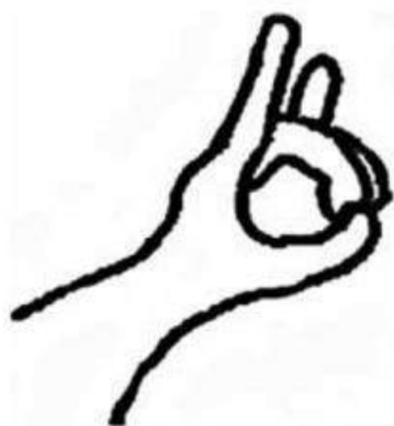
Mudra ban phép, giai đoạn 1.

dùng tay trái, nữ dùng tay phải. Xòe hết năm ngón tay ra, rồi cong ngón giữa và ngón đeo nhẫn lại sao cho chúng chạm vào ngón cái. Khi hai ngón tay đó đã chạm vào ngón cái, mudra này đã trong vị trí sẵn sàng.