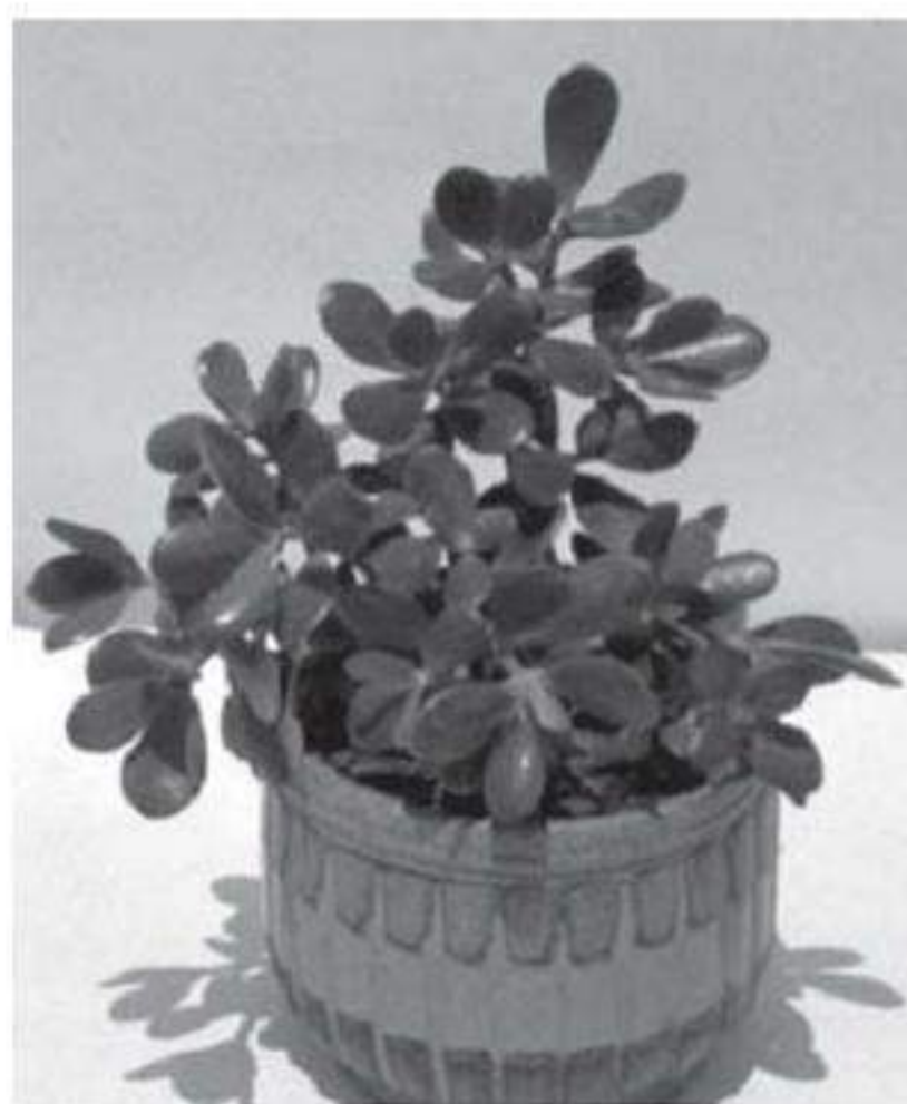
Cây Thạch bích

Hành Thủy thường được sử dụng ở cung Tốn, bởi nước nuôi dưỡng cây, tạo nên sức tăng trưởng ở khu vực này. Các vòi phun nước cũng đặc biệt hữu dụng cho cung này, và tôi thích đặt một vòi nước là một tượng