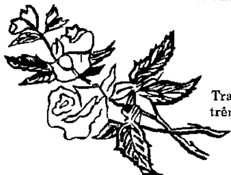
Trang trí trên cánh