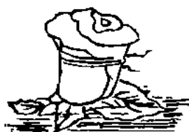
Buộc dây ngâm nước