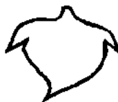
Khối có tiết diện tròn