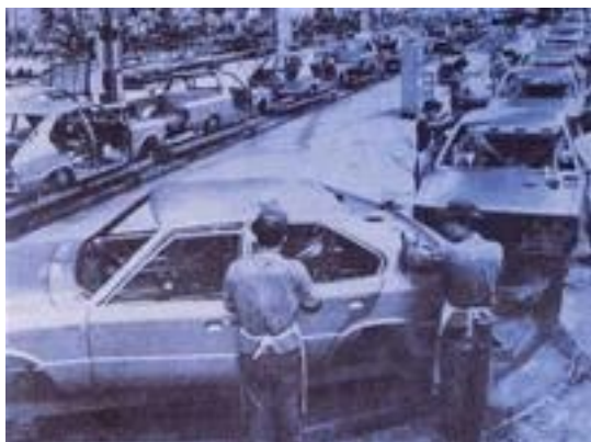
Xe Pony - nhãn hiệu ô tô đầu tiên có tỉ lệ nội địa hóa 100% vào