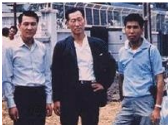
Chung Ju Yung (giữa) tại VN năm 1966

TT - Hồi còn làm lao động ở bến cảng Inchon, tôi đã ở trọ một nơi đúng là thiên đường cho rệp trú ngụ. Rệp nhiều đến mức không thể ngủ được dù rằng cơ thể rã rời sau một ngày làm việc nặng nhọc.