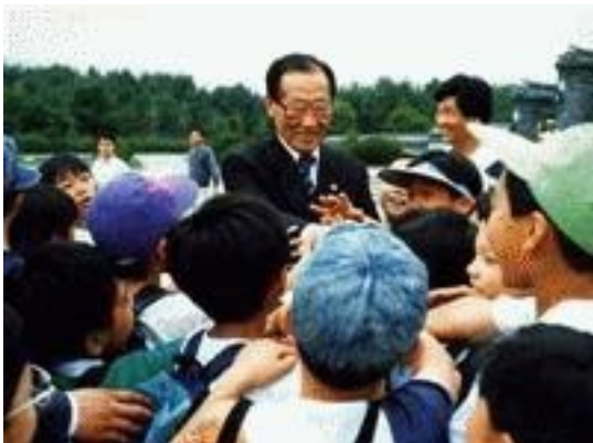
Chung Ju Yung năm 1992

Phần XIII: Một con người dám thực hiện ước mơ